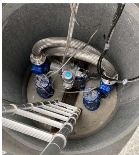
(Hybrid bypass station)

Forslag: Derfor foreslår bestyrelsen, at vi hurtigst muligt starter hensættelser til dette projekt. Herved forstås en kontingentforøgelse. Denne debatteres sammen med en tidsplan og punkt 8 på dagsordenen (Foreningens budget fremlægges og godkendes ).